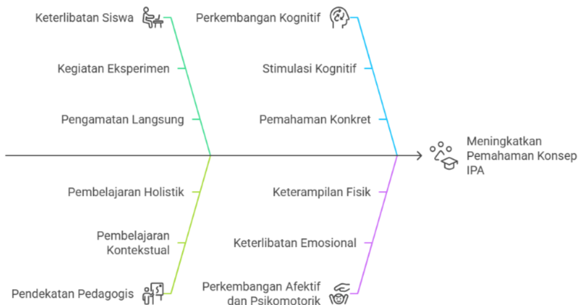
Gambar 2. Meningkatkan Pemahaman Konsep Melalui Model CTL

dengan karakteristik perkembangan siswa SD yang cenderung konkret-operasional. Dalam konteks ini, pendekatan Contextual Teaching Learning bukan hanya strategi penyampaian materi, tetapi juga sebagai media pembentukan pemahaman yang bersifat holistik. Hasil ini senada dengan pendapat Putri & Indarini (2023), yang menyatakan bahwa keterlibatan aktif siswa melalui model pembelajaran berbasis konteks dapat meningkatkan kualitas belajar serta meminimalisasi miskonsepsi dalam sains dasar.