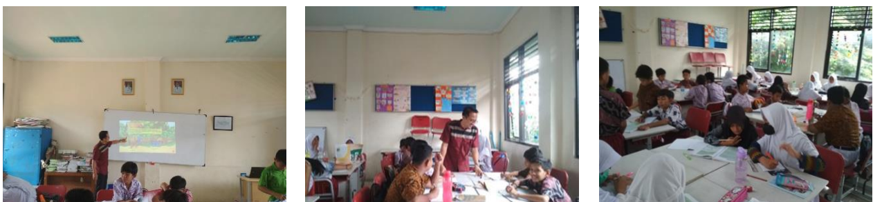
Gambar 2. Kegiatan Penelitian Tindakan Kelas

Berikut dokumentasi kegiatan pembelajaran yang telah dilakukan di UPTD SD Negeri Tapos 5 Kota Depok mata pelajaran IPA materi alat gerak hewan vertebrata dan invertebrata!